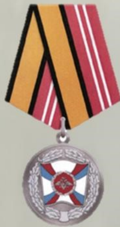
МЕДАЛЬ "ЗА УКРЕПЛЕНИЕ БОЕВОГО СОДРУЖЕСТВА"