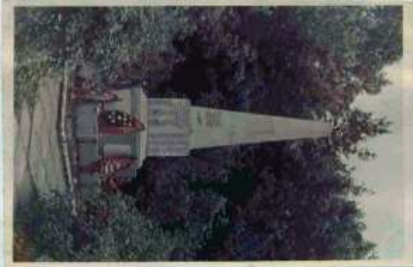
11. Изготовленная информация о захоронении