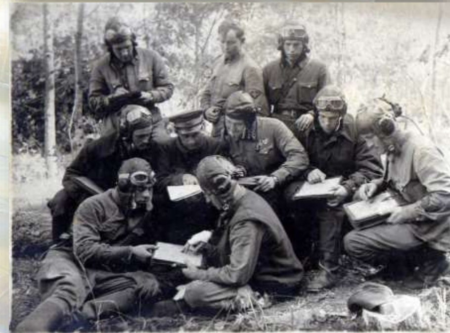
Оригинальное фото летчиков 241 ШАП