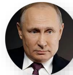
В.В. Путин Президент РФ